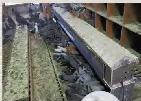
★2年前から自動給餌機を使用。昨春は常に満腹になるまで食べていたようだ。

一方の管理面では、米田鳩舎自身73歳でありながら、仕事はまだまだ現役ということで、趣味に割ける時間は決して多くない。そこで2年前から自動給餌機を使うことで、自身の負担を軽くし、結果調教面に集中できるようにした。さらに昨春には、訓練を手伝ってくれる鳩仲間まで現れるにいたり、これまでインターバルでは多くて2回(*40K、60K)止まりだったところに90Kが