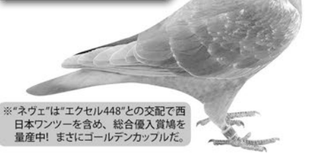
※“ネヴェ”は“エクセル448”との交配で西日本ワンツを含め、総合優入賞鳩を量産中! まさにゴールデンカップルだ。