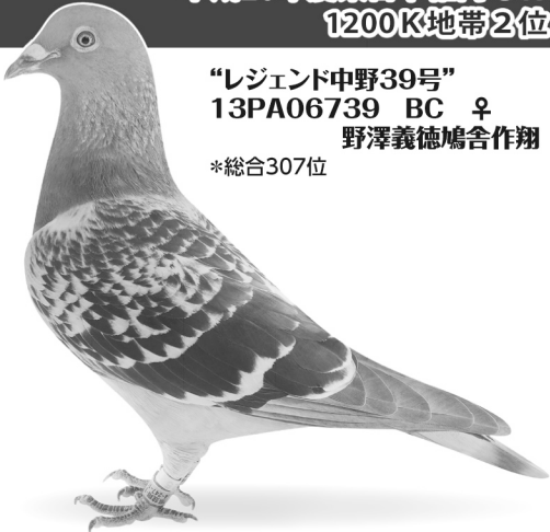
“レジェンド中野39号” 13PA06739 BC ♀ 野澤義徳鳩舎作翔 *総合307位